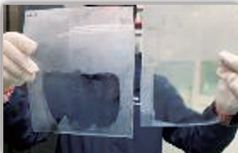
抗結露之表面硬質塗層