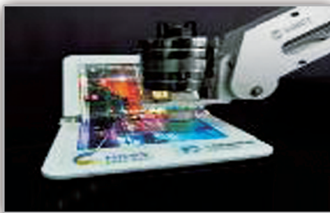
內摺式可撓顯示器之表面硬質塗層