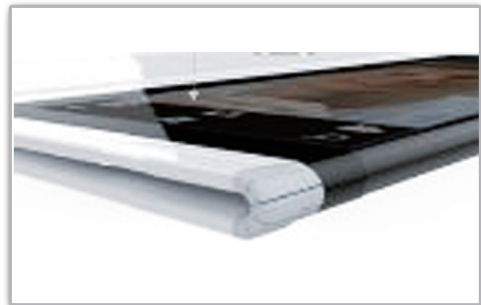
外摺式可撓顯示器之表面硬質塗層