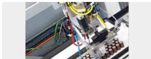
• 高速電池取放：採用Festo龍門EXCH