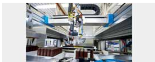
• 以平面龍門EXCH踏出創新的一步：該電動汽車電池試點組裝線中採用的自動化科技，原先開發用於太陽電池的生產。非常適合抓取精密元件，並以高精度置入

60，該平面龍門用於高速組裝工作，快速靈活地定位大批量製造的小而輕的產品。由兩台固定馬達驅動，EXCH有著最優秀的動態響應。不需要每個軸都使用個別的龍門，就能精確對齊。其速度可達5 m/s、加速度可達50 m/s 2 ，能每分鐘抓取100次，重複精度±0.1 mm。