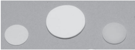
▲圖二 中國製釉固態電解質陶瓷片應用於鈕扣電池

其宣布開發氧化物固態電解質搭配高電壓鎳錳尖晶石正極材料之無陽極電池引起學術界與產業界之廣泛關注。此外，輝能公司為台灣最早進入固態電池開發公司之一，其早期布局消費類電子產品之電池，近年亦導入動力電池開發，並發布基於陶瓷固態電解質之固態電池，其於去年宣布將於法國敦克爾克投資52億歐元（約新台幣1,743億元）建廠，此為輝能海外首座固態電池超級工廠，預計最遲2027年初竣工，其將於該地建立48 GWh的固態電池超級工廠，執行在地化的材料採購、研發與製造。台塑新智能之大型儲能已設立1.2 MW/1.3 MW（兆瓦）儲能系統連接台電電網，另規畫建置100 MW/300 MW電網級超大型儲能站，以及自動化模組產線（含家用儲能、中大型電池模組產線）。為因應未來市場需求，台灣中油已於高雄建立鈦酸鋰負極材料新廠，大幅擴增產能。此外格斯則與台灣廠商密切合作，其中供應負極材料的中油，堪稱是格斯最重要之戰略夥伴。