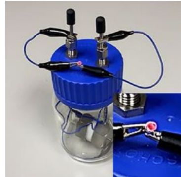
▲圖三 固態鈉二氧化碳(Na-CO 2 )電池點亮紅色LED

中國製釉(China Glaze)憑藉陶瓷材料之燒結、切割、研磨之核心技術，專注於氧化物固態電解質LLZTO、LAGP、LATP等材料，如圖二所示，具穩定的離子導電率(>0.5 mS/cm)，並可客製化陶瓷片尺寸或粉體粒徑，為台灣業界提供全固態電池之發展機會。