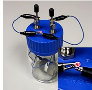
▲圖三 固態鈉二氧化碳(Na-CO 2 )電池點亮紅色LED

化碳(Na-CO 2 )，其由正極、負極、無機固態電解質片組成，如圖三所示。為增進電極與無機固態電解質片之接觸亦可引入正極/負極界面層。其可實現室溫充放電，且放電容量可高達 28,830 \text{ mAh g}^{-1} 。於電流密度為 100 \text{ mA g}^{-1} ，截止電容量為 500 \text{ mAh g}^{-1} 之條件下，可穩定循環105次。本發明已獲台灣之專利，因此電池之比容量高且其較鋰來源便宜。同時此電池利用CO 2 為正極材料，一方面提高CO 2 捕獲的經濟性，另一方面可以減少CO 2 的積累。於能源存儲與碳中和應用方面具有一石二鳥的效果。而火星的大氣環境約95%是CO 2 ，故鈉二氧化碳電池於未來的能源儲存、碳中和與火星探測將具產業應用之潛力。🔗