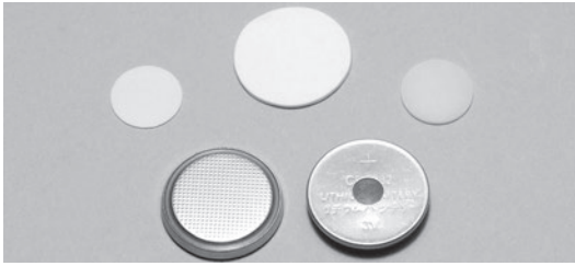
▲圖二 中國製釉固態電解質陶瓷片應用於鈕扣電池

術界與產業界之廣泛關注。此外，輝能公司為台灣最早進入固態電池開發公司之一，其早期佈局消費類電子產品之電池，近年亦導入動力電池開發，並發布基於陶瓷固態電解質之固態電池。其於今年宣布將於法國敦克爾克投資52億歐元（約新台幣1,743億元）建廠，此為輝能海外首座固態電池超級工廠，預計在2026年底開始生產，其將於該地建立48 GWh的固態電池超級工廠，執行在地化的材料採購、研發與製造。台塑新智能之大型儲能已有三座MW（兆瓦）級儲能系統連接台電電網，另還有三座超過5 MW的儲能系統將上線，而其家用儲能預定今(2023)年第四季起於台灣市場銷售。為因應未來市場需求，台灣中油已於高雄建立鈦酸鋰負極材料新廠，大幅擴增產能。此外格斯則與台灣廠商密切合作，其中供應負極材料的中油，堪稱是格斯最重要之戰略夥伴。