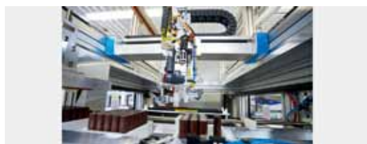
• 以平面龍門EXCH踏出創新的一步：該電動汽車電池試點組裝線中採用的自動化科技，原先開發用於太陽電池的生產。非常適合抓取精密元件，並以高精度置入

60，該平面龍門用於高速組裝工作，快速靈活地定位大批量製造的小而輕的產品。由兩台固定馬達驅動，EXCH有著最優秀的動態響應。不需要每個軸都使用個別的龍門，就能精確對齊。其速度可達5 m/s、加速度可達50 m/s 2 ，能每分鐘抓取100次，重複精度±0.1 mm。